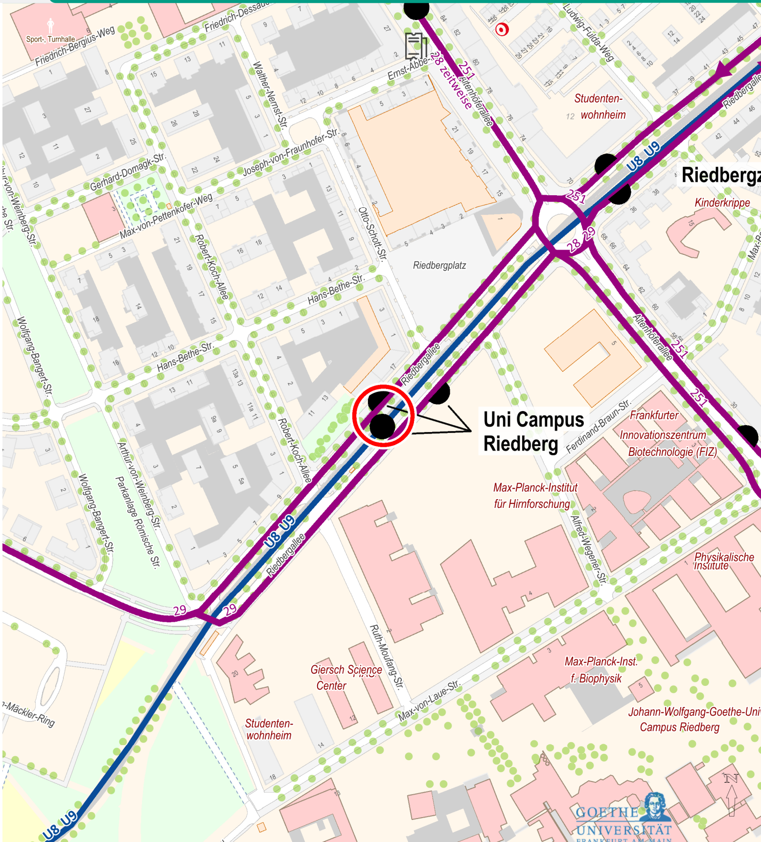
Kartengrundlage: Stadtvermessungsamt Frankfurt am Main 2015. Alle Angaben ohne Gewähr. Änderungen vorbehalten. Stand Dezember 2015