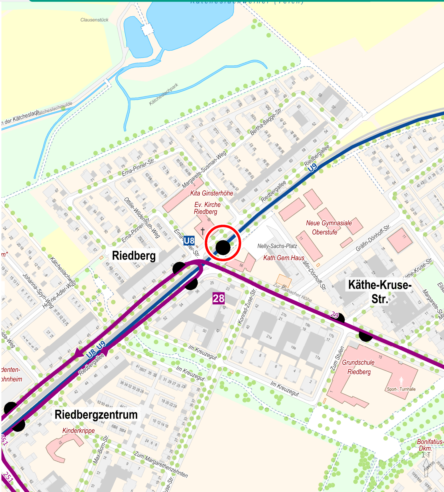
Kartengrundlage: Stadtvermessungsamt Frankfurt am Main 2015. Alle Angaben ohne Gewähr. Änderungen vorbehalten. Stand Dezember 2015